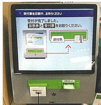
ここから発行されるバーコード付きの受付票を取っていただきます。